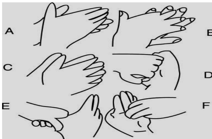
Figura 1 – Procedimento de lavagem das mãos